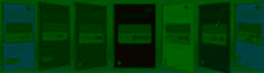
一体化课程教学设计 综合实训基地